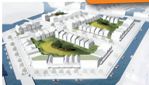
Impressie eengezinswoningen 'Westland Hills' (Waterkamer 1)