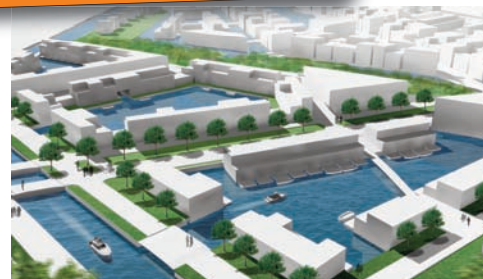
Impressie 'Watertuinen' (Waterkamer 1)