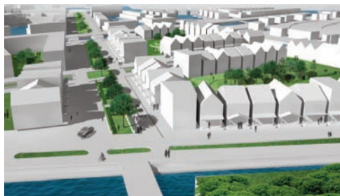
Impressie eengezinswoningen 'Westland Hills' (Waterkamer 1)