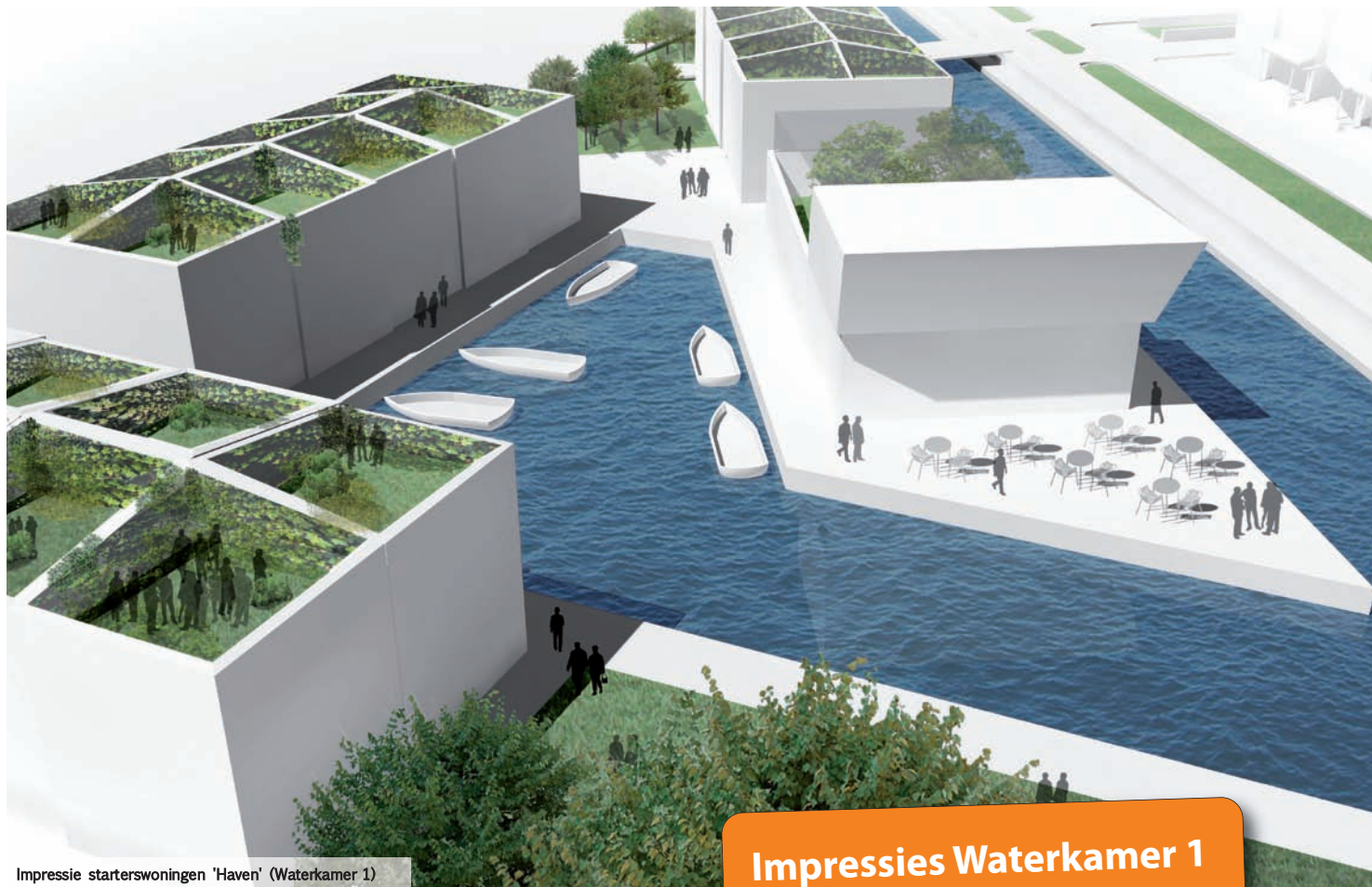
Impressie starterswoningen 'Haven' (Waterkamer 1)